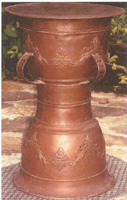
Bronzen keteltrom "Mokko" 1850 Alor / Pantar