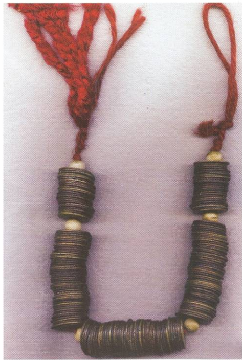
Snoer van 200 Chinese cashmunten "Atak" Vanaf 1735 Ch'ien Lung Bali / Lombok