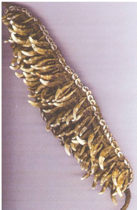
Voorhoofdsband met ruim 100 hondenhoektanden. Omstreeks 1930 Maprikgebied, Nieuw Guinea