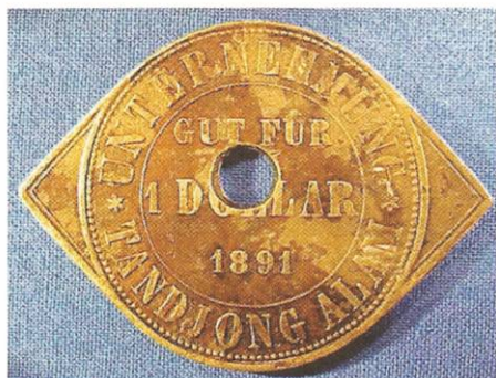
1 Dollar 1891 Plantage Tjandjong Alem, Sumatra