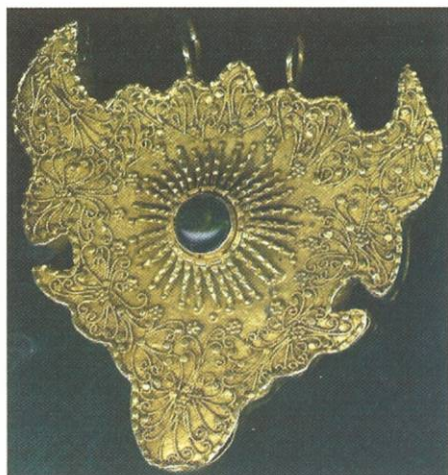
Gouden Bruidshanger 19 e eeuw Makassar, Sulawesi (Celebes)