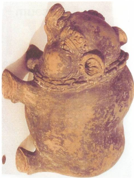
Spaarvarken "Tjélengan" voor Chinese cashmunten Madjapahit Trowulan, Java begin 14 e eeuw