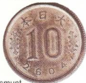
Japanse bezettingsmunt 10 sen 2604 (1944)