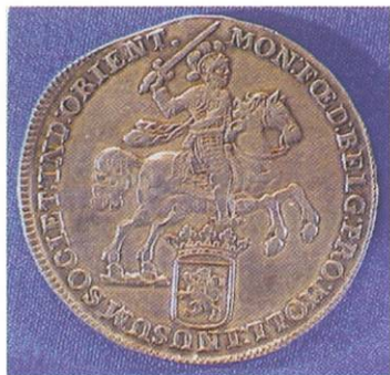
VOC Ducaton of Zilveren Ridder Holland 1741