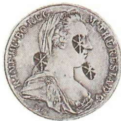
Maria Theresia Thaler 1780 met 3x instempeling (klop) Soemenep, Madoera