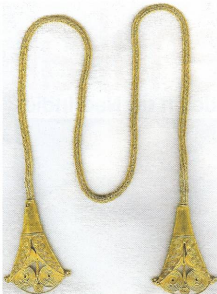
Gouden halssieraad "Kanoar" Bruidsschat Oost Sumba omstreeks 1930